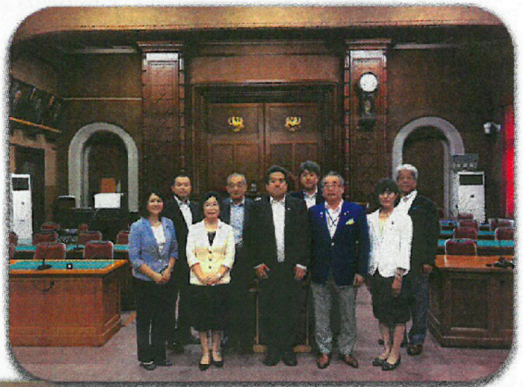
会津若松市議会本会議場