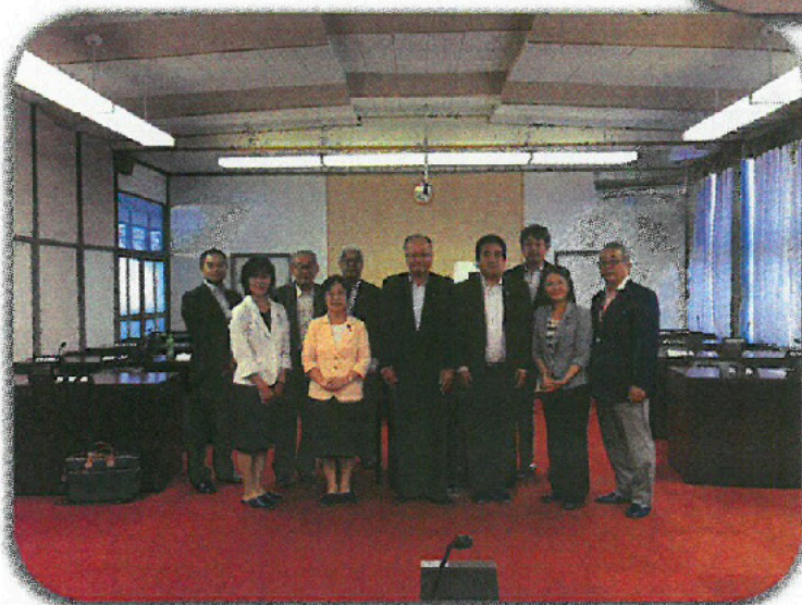
会津美里町議会本会議場