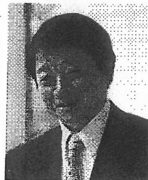
早稲田大学公共経営大学院教授