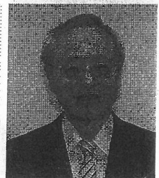
東京大学名誉教授