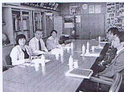
日進北小学校内の会議室で説明を受ける議員団