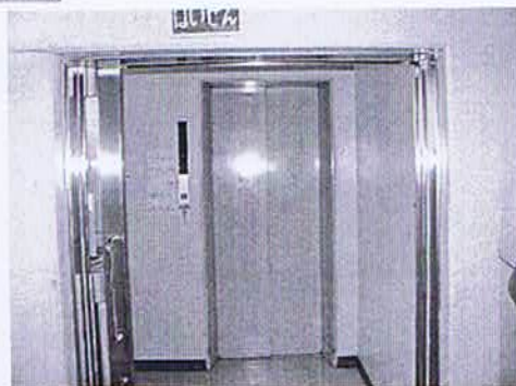
調理場内部の設備（左）と食缶等の搬送E.V