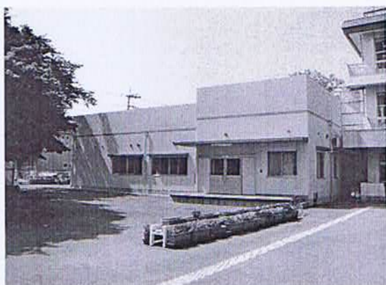
校舎東に位置する調理棟