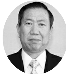
議長 秋坂 豊