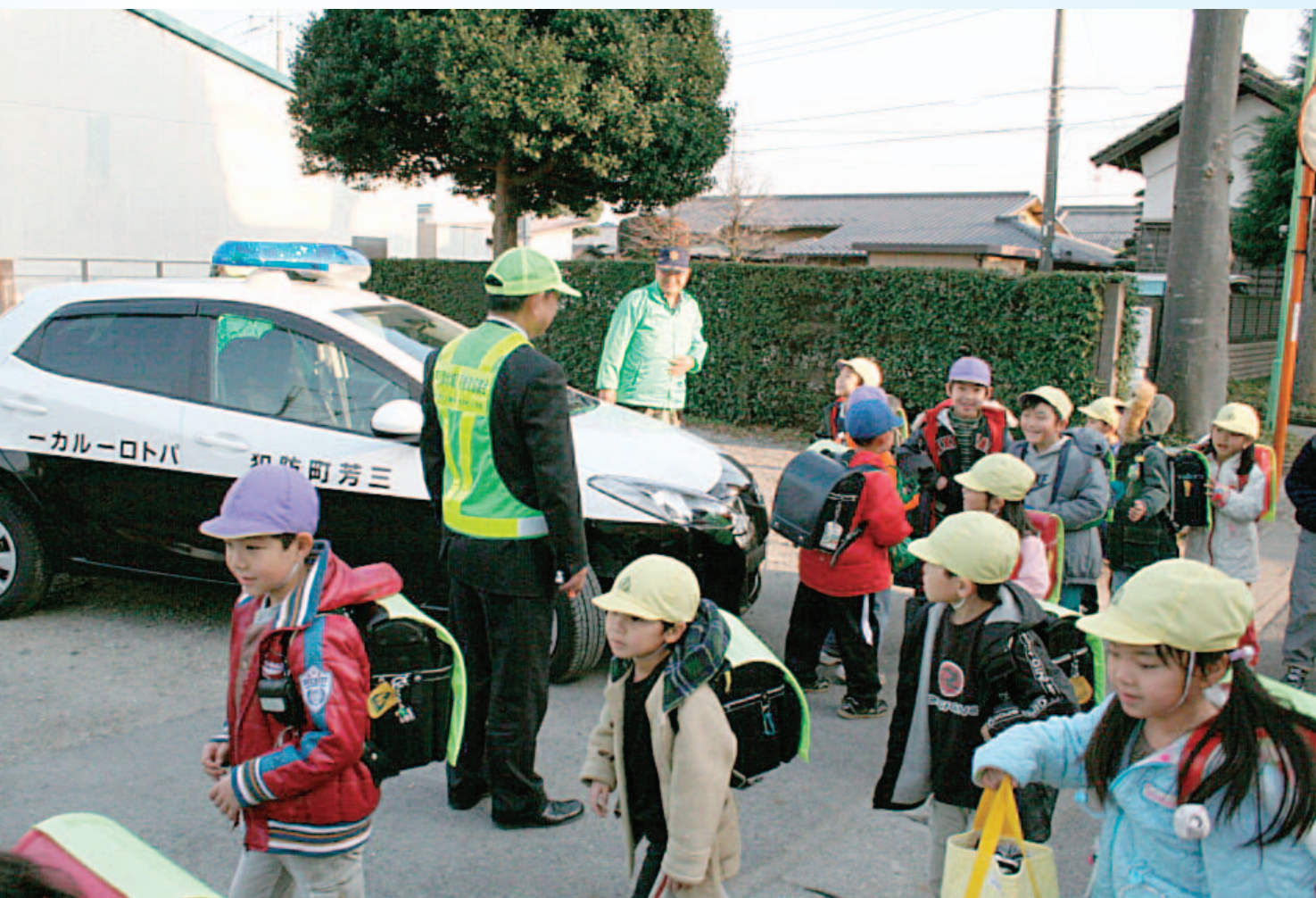
青色パトロールカーに見守られながら下校する子どもたち