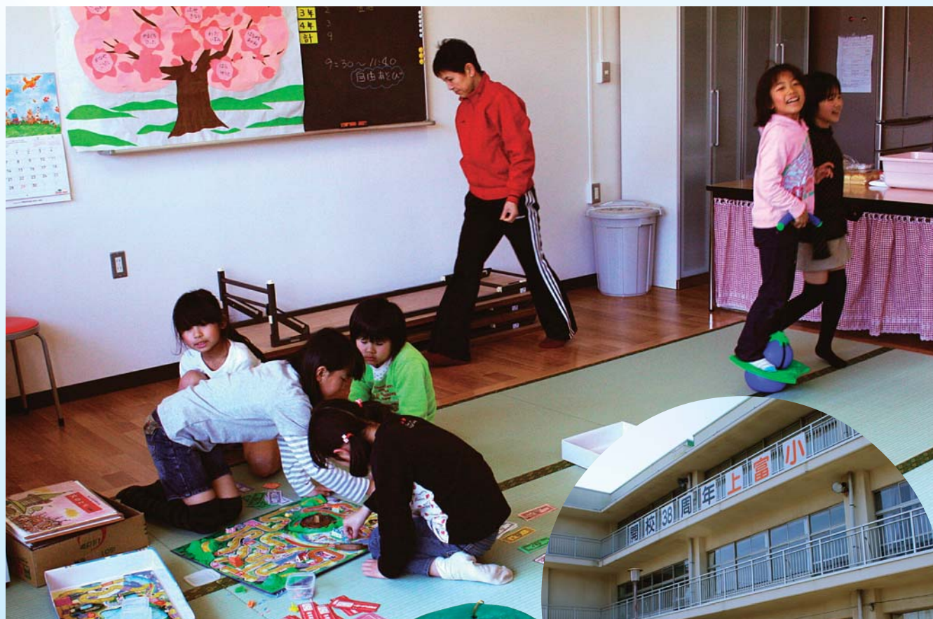
新設された 上富学童保育室