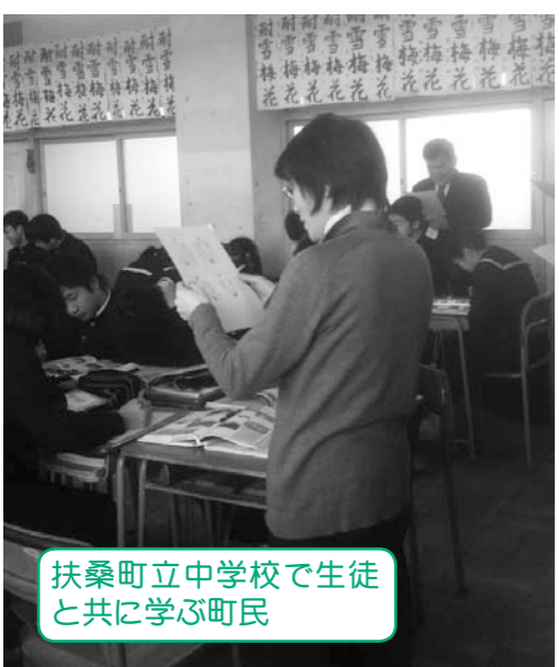
扶桑町立中学校で生徒と共に学ぶ町民

問 昨年度以降も国庫補助等の状況にかかわらず、事業継続をどうするか。 答 健康福祉課長 新年度は継続するが、その後は財源をどうするか等を検討したい。