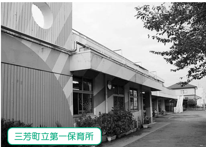
三芳町立第一保育所