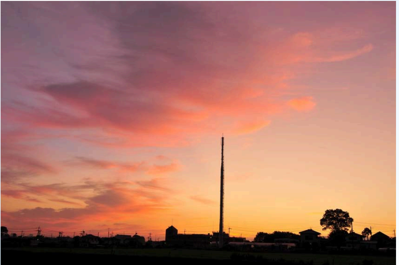
竹間沢の朝