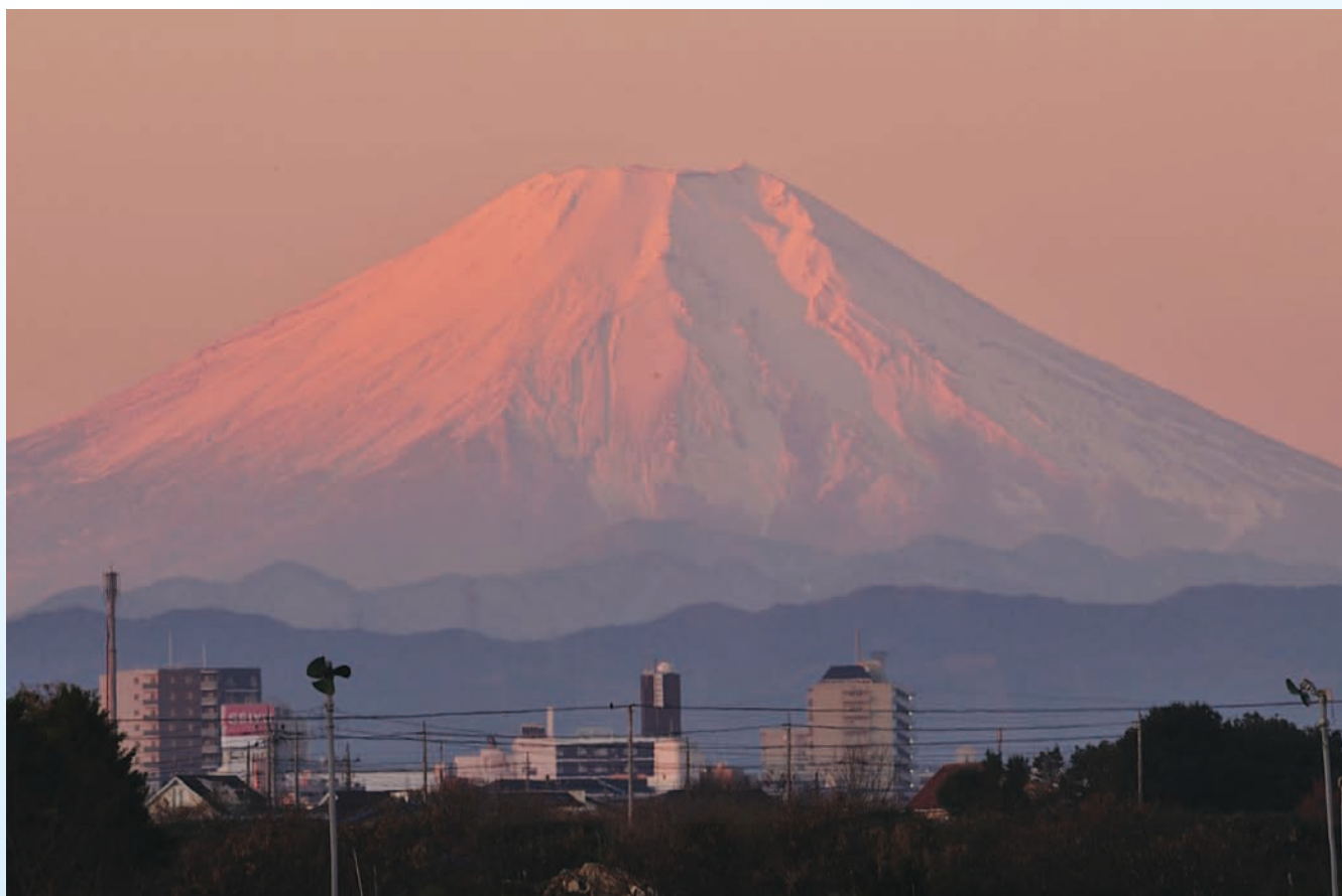
上富の朝