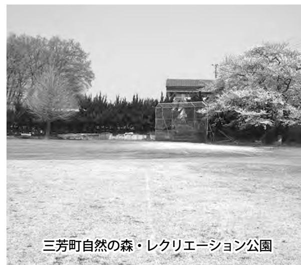
三芳町自然の森・レクリエーション公園

三芳町の青少年少女の健全育成及び地域住民の交流やレクリエーション活動の場として寄与するため、三芳町自然の森・レクリエーション公園を設置するため、本条例を制定する。