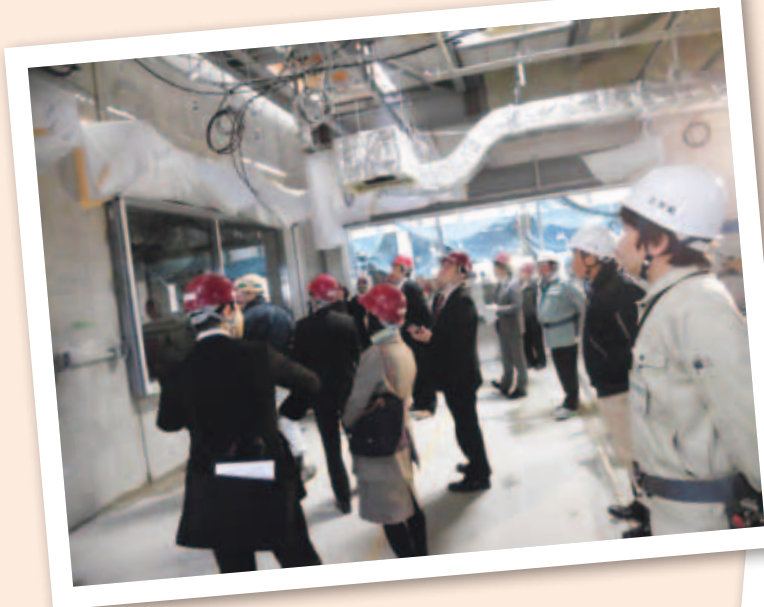
ふじみ野市と共同で建設中の広域ごみ処理施設へ三芳町議会で視察に行きました。 すでに余熱利用施設工コパが開設されていますが、ごみ焼却施設本体は、7月14日から試運転、10月末には本格稼働とのことです。