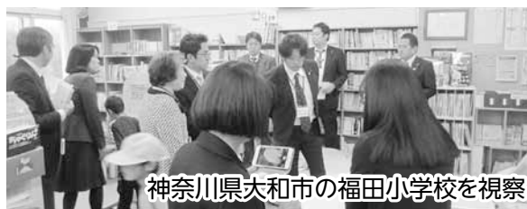
神奈川県大和市の福田小学校を視察