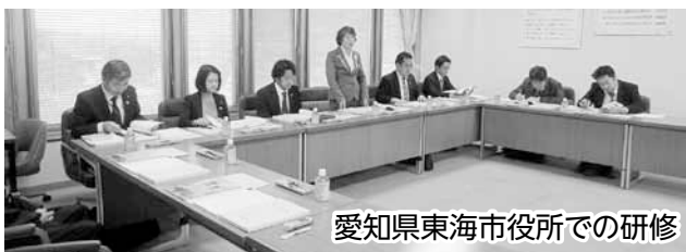
愛知県東海市役所での研修

視察研修では、放課後の児童の居場所づくりや学習支援として取り組んでいる姿を見ることができました。学校・社会教育・児童担当・福祉担当など様々な関連の課との連携の大切さも学ぶことができました。