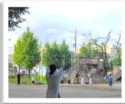
夏休みラジオ体操