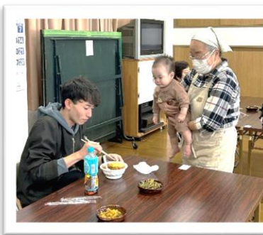
子ども・大人食堂の開催