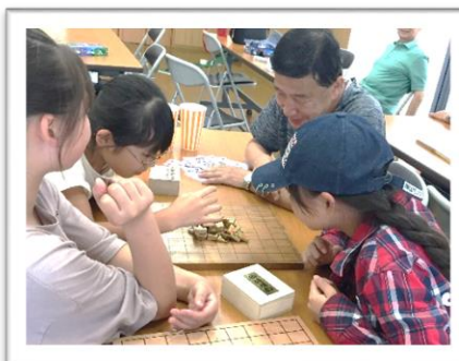
あつまれ集会所 藤久保2区