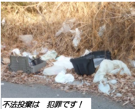
不法投棄は 犯罪です！