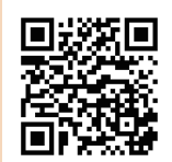
三芳町観光産業課 Instagram