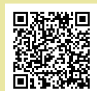
スタンプラリー対象店マップ