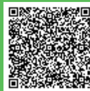
スタンプラリー 対象店マップ

三芳産そばはねばりが強く、 十割そばにしても歯切れや のどごしが良いのが特徴です♪