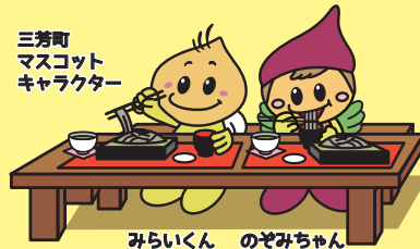
三芳町 マスコット キャラクター

お店ごとに対象メニューが異なります。詳細はお店にお問合わせ ください。対象メニュー以外にはスタンプを押印することができません。