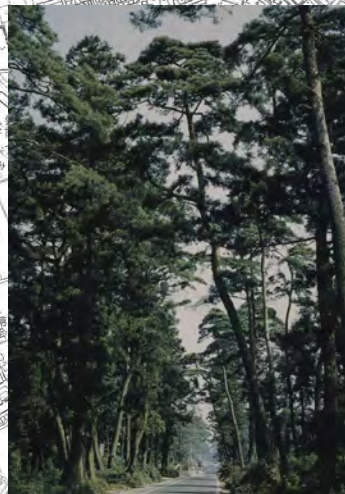
③ 川越街道 (昭和45年撮影)