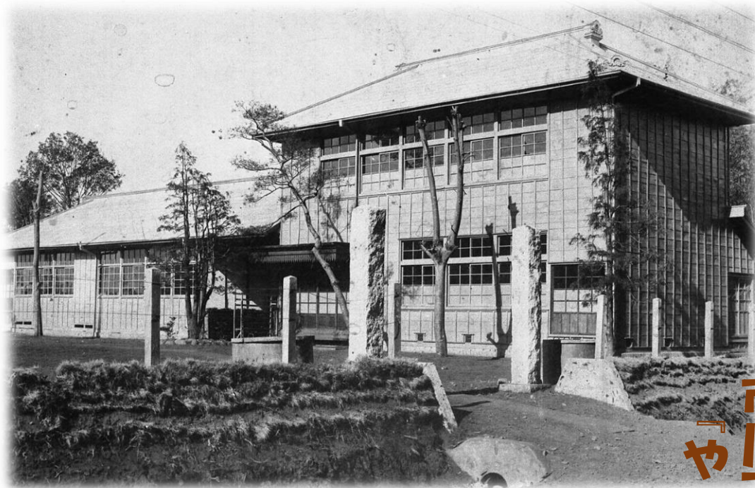
▲物語の舞台となる上富分教場（昭和3年頃）