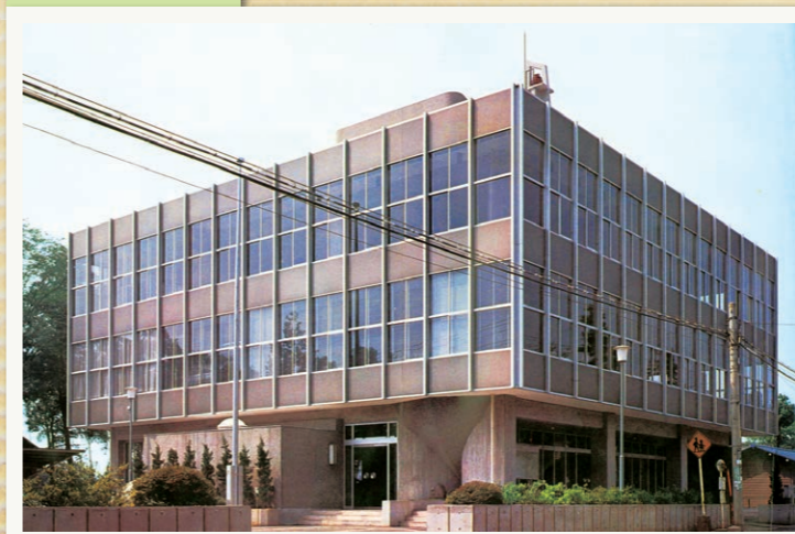
北永井に建築された旧役場庁舎(地下1階地上4階建)。業務の増加に伴い庁舎が手狭になったため、1982年には鉄骨三階建ての第二庁舎が南側に増築されました。藤久保にある現在の役場庁舎は1994年に建築されたものです。