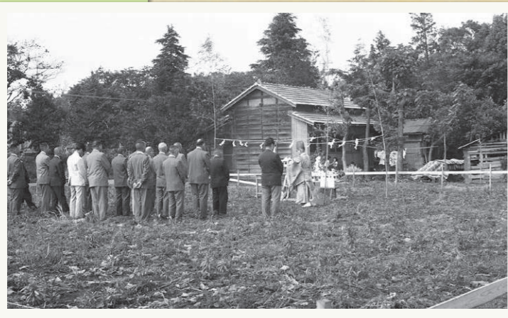
旧中央公民館の新築工事にあたり地鎮祭を執り行う様子。この頃はまだ三芳村でした。