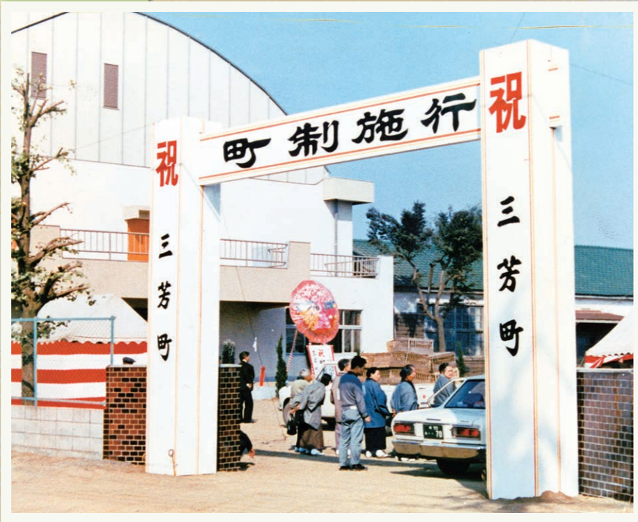
町制施行記念式典が開催された三芳中学校体育館(同年に完成)。初代町長より、町制施行が高らかに宣言されました。