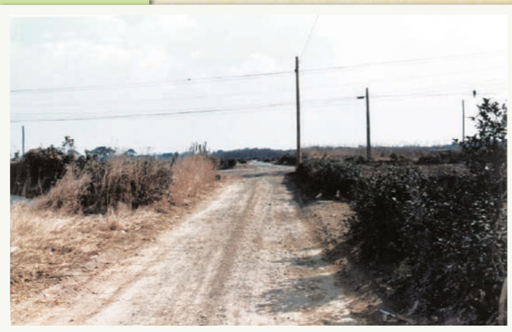
藤久保の鎌倉街道の様子です。未舗装で交差点には信号もなく、古道の面影が残ります。