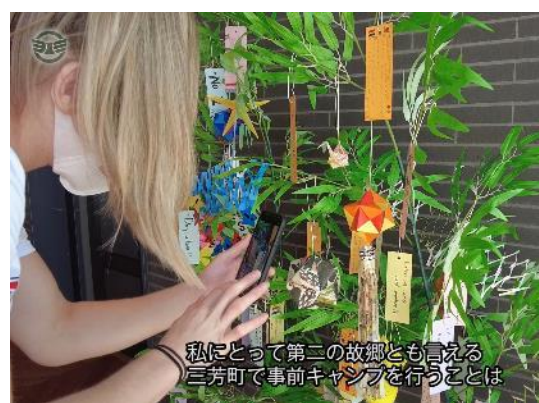
私にとって第二の故郷とも言える 三芳町で事前キャンプを行うことは