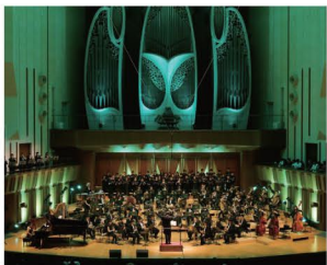
プラス・エクシード・トウキョウ

オランダ女子柔道銅メダリストのサンネ・ファン・ダイケ選手、マレーシアのパラリンピックメダリストとパラリンピック委員会が中継出演!