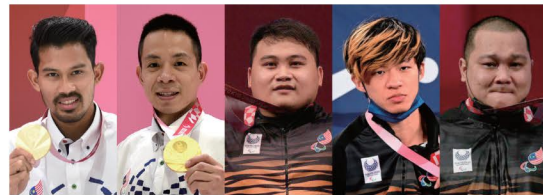
パラリンピックメダリスト (マレーシア)