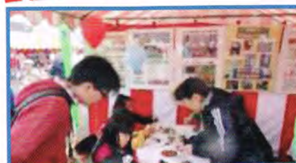
産業祭でワークショップ