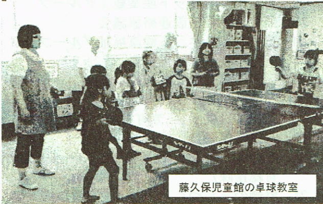
藤久保児童館の卓球教室

藤久保児童館の卓球教室（夏休み事業）は、8月19日（木）午後2時～です。これから私たちは何をしようか？順番を決めてやろうよ!! 皆様のご参加をお待ちしています。