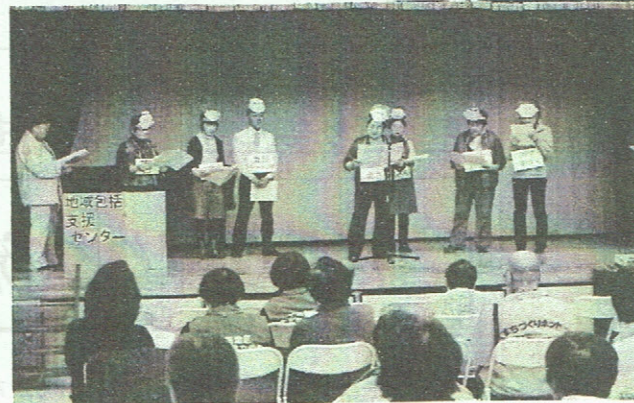
(上)男女共同参画推進会議による寸劇