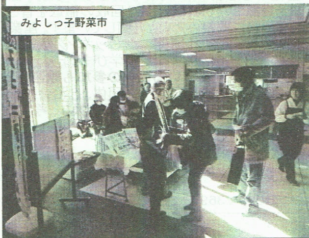
みよしっ子野菜市

「お互いに顔見知りになる」ことをモットーに、枝豆狩り(8月上旬)、芋掘大会(10月3日)、里芋の種芋掘り(12月初旬)、雑木林(ヤマ)掃き(1、2月日曜日)等々の行事のご案内をしていこうと思っております。皆様の参加をおまちしております。また、「三芳やさいのブランド化」のサポートや、別名：カスタード・アップと呼ばれている果物「ポポー」の栽培にも引き続き挑戦して行く所存です。ご一緒に活動していただける方を募集しております。ご自分の都合に合わせてご参加いただけます。美味しい空気と野菜たち、素晴らしい仲間が待っています。是非下記あてにご連絡ください。