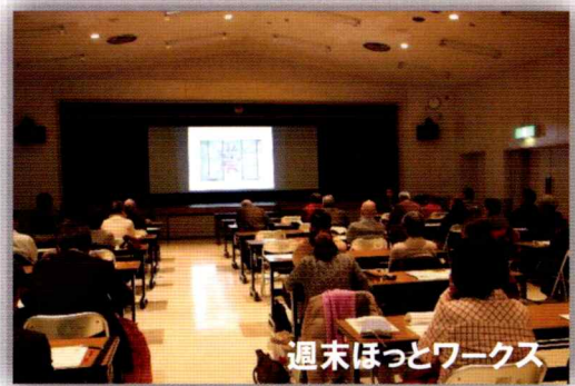
週末ほっとワークス

町内にある企業や社会活動に取り組んでいる方々から、日常生活を取り巻くゴミの問題・食の安全・生きるための環境問題やホテルの育成・菜の花の栽培など美しい環境づくりについて学び“いま”を知りそして未来を考える。そんな教育文化グループでありたい。