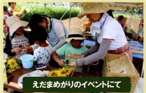
えだまめがりのイベントにて

また、サツマイモの苗植えや、枝豆の種まき、収穫を体験しながら、農家の方ともふれあい、平地林の中で過ごす楽しさも味わいました。あなたの少しの時間でいいのです。どのような活動ができるか、みんなで考えながら、ご一緒に土やヤマに親しんで過ごしてみませんか。