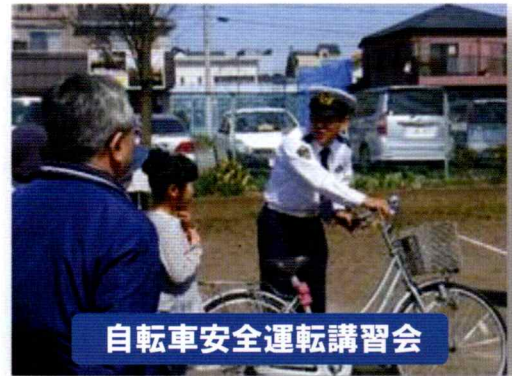
自転車安全運転講習会