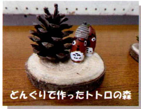
どんぐりで作ったトトロの森

みどり環境グループへ参加したい方(体験入会可)は、町の環境課へ連絡をしてください。