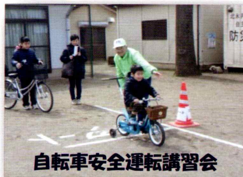
自転車安全運転講習会

この講習の第1の目的は、自転車に関する事故の撲滅に少しでも貢献したいということですが、さらにもう一つの目的は、町内の多くの団体が一つの目的のために心を一つにして活動することの意義を感じ、素晴らしさを知ることです。今回も、東入間警察署、役場自治安心課、二輪車安全普及協会のご協力を頂き、さらに加えて、行政区、民生委員、児童館、育成会、交通安全母の会、交通安全指導員など多くの団体の方々为主旨にご賛同頂き、ご協力が得られたことは大変素晴らしいことでした。親子そろっての参加者も多く、「家族そろって……」が理解され、目的に少しでも近づいたようです。ご協力頂いたすべての団体の方々に心から御礼を申し上げますとともに、この活動がぜひ全町内に広がって行くことを願っております。