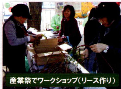
産業祭でワークショップ(リース作り)

毎週水曜日午前中は役場のロビーで、第4土曜日は中央図書館前と体育館のみよし野菜を販売しています。また、トウモロコシ、枝豆、サツマイモなどの収穫体験と雑木林での遊び、落葉掃きなども企画しています。何ができるか皆様のアイデアを聞かせてください。