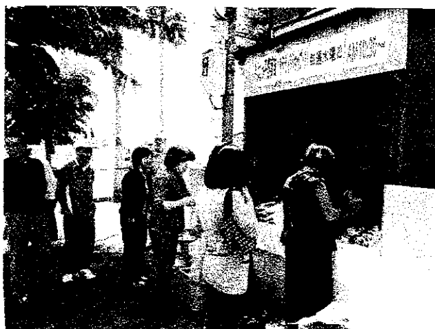
「みよっ子野菜市」サテライトショップ第1号店

ンティア内の交流だけではなく、農家との絆を深めていきます。町の各地にサテライトを設けていきたいので、たくさんの方々の参加をお願いします。