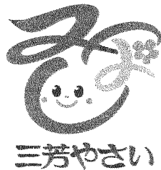
「三芳やさい」のロゴマーク

現在、産業観光グループの仲間として一緒に活動していただける方を募集中です。ご自分のご都合に合わせてご参加いただければ幸いです。美味しい空気と野菜たち、素晴らしい仲間が