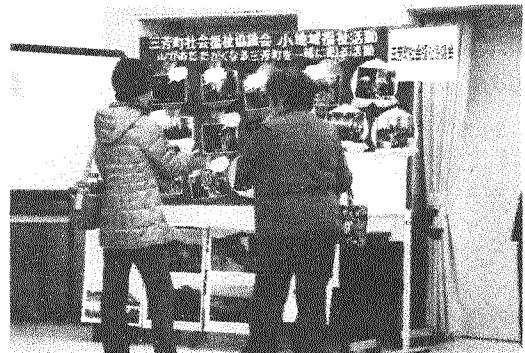
←まちづくり団体の一つとして出展した三芳町社会福祉協議会のPRブース