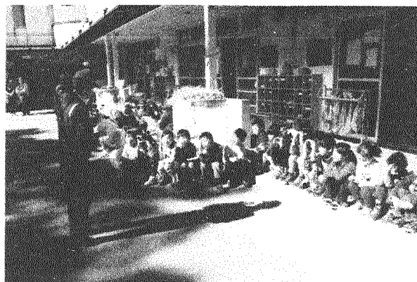
保育所での婦警さんによる交通安全教室(第2保育所で)