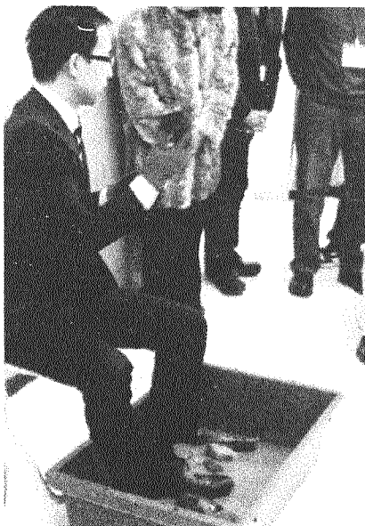
「三芳の学校—歴史講座」での黒曜石の矢じり作り

昨年から続けてきた「三芳の学校—歴史講座」は、お陰様で多くの方々に受講していただき、4月末をもって一旦終了しました。これを入門にして、今後も町の文化や歴史についての情報を発信し、共有するための活動を行っていきます。