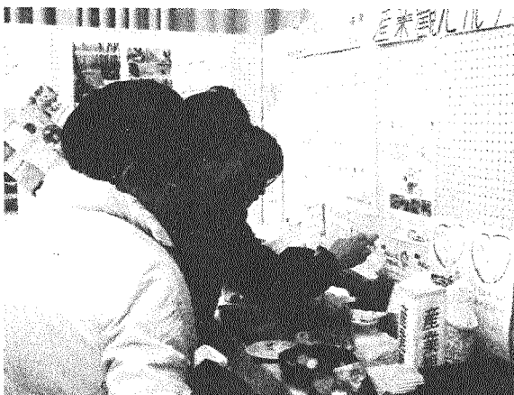
↑産業観光グループのPRブースを熱心に覗き込む来場者