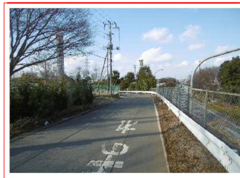
町道上富69号線（現況）