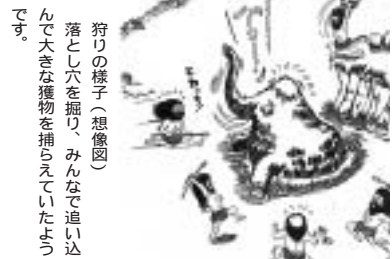
狩りの様子(想像図) 落とし穴を掘り、みんなで追いついて大きな獲物を捕らえていたようです。

国内最古の藤久保東遺跡群 旧石器時代の遺跡は、現在全国で1万箇所が知られますが、3万年前の日本列島最古の遺跡はあまり多くありません。しかし、藤久保東遺跡群では全国でも珍しく、3万年前の生活跡が3箇所も発見されました(藤久保東遺跡から2箇所、藤久保第二遺跡から1箇所)。刃先の部分だけを磨いた大型の石器が3点、その他にはナイフに使ったと思われる石器や長さ3〜4cmほどの刺突具のような石器等が多数発見されています。大型の石器はオウゾウジカやナウマンゾウなどを解体する道具、小型の刺突具石器は魚などを突く道具とも考えられます。