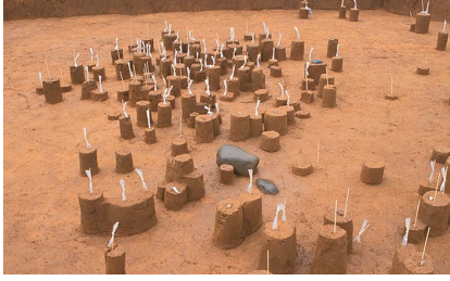
石器製作跡 細かな破片が散っています。(藤久保東遺跡)

旧石器時代は気候的には氷河の時代。現在より冷涼で平均気温は3度くらい低く、火山活動も活発で火山灰が常に降っていたようです。地下の赤土は火山灰が風化してできたもの。当時の気候条件は悪く、旧石器時代の狩猟生活は不安定だったようです。藤久保東の地に来た人々も獲物が移動してしまつと、その獲物を求めて去つてしまいます。遺跡からキャンプの跡が発見されても、定住した住居跡が見つからないのは、そうした環境が背景にあったためです。