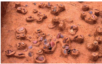
調理跡 河原石が真っ赤に焼かれています。(藤久保東遺跡)

約1万8千年前の地層から3mくらいの広がり、真っ赤に焼けた河原石が集中して何箇所も発見されました。河原石は1箇所です。3千個ある場合もありました。焼石の上で、現在でいうバーベキューのように魚や肉を焼いたり、熱した石の上で、焼けるまで焼いたり、焚火の煙で燻製し、保存食を作ることが想像されます。冷涼な氷河時代、食料確保や保存は重要でした。焼けた河原石の集中は、藤久保東遺跡群で81箇所も発見されています。