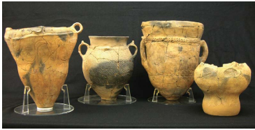
縄文時代中頃(約3,500年前)の土器です。保埜遺跡では他にも、縄文時代の集落跡や奈良・平安時代の製鉄作業場跡などが見つかっています。(資料館に展示)