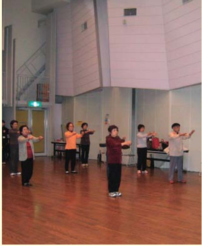
みよしもっこ体操

町では身体を動かすことが減っている方に、介護予防事業として次のような事業を実施しています。 申し込み・問い合わせ 保健センター ☎258-1236