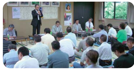
▲昨年のまちづくり懇話会の様子

※なお、開催期間中に国政選挙が行われることになった場合は、一部日程について変更又は中止となる場合がありますので、予めご了承ください。