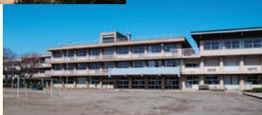
現在の三芳小学校