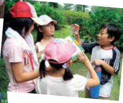
←②夏休みみよしまち探検隊