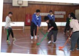
⑦レクリエーション研修