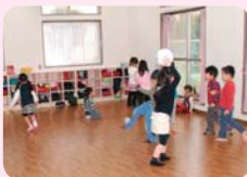
▲竹間沢第2学童保育室