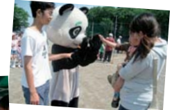
←①子どもフェスティバルの様子