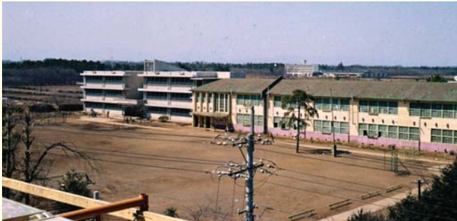
左…昭和44年建築の新校舎・右…昭和29年建築の旧校舎

編集/秘書広報室 〒354-8555 埼玉県入間郡三芳町大字藤久保1100番地1 ☎049-258-0019 発行人/三芳町長 鈴木英美 http://www.town.saitama-miyoshi.lg.jp/