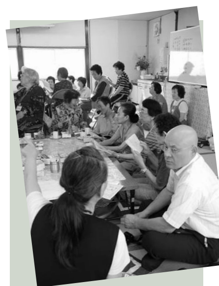
傾聴ボランティア「なごみ」懇談の様子