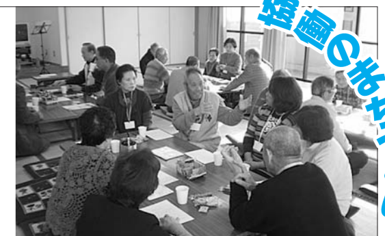
北永井第2区のふれあいサロン

○ふれあいサロン/健康福祉グループ ふれあいサロンは、高齢者が気軽に集う場所です。北永井第2区のサロンでは、毎回楽しい行事を組み、多くの方が参加しています。3月のサロンでは、懐かしい歌を合唱しました。また、参加者の高齢の女性から地震のときの話を聞きました。一人で留守番をしていたがベットのうえで全く動けなかった事、怖かった事、テレビで津波や原発事故の恐ろしさを見て不安が大きくなった事などなど…。家族とはまた違った話ができなかったが、今日は話ができてよかったという声がかれました。 このようなサロンの町のあちこちにつくりたいと思います。 問い合わせ 健康福祉グループ 柄澤 ☎(258) 2178 又は役場・福祉課 ☎(172) まで