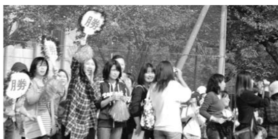
▶子どもたちを応援する保護者の皆さん

は、中学校の体育の先生や陸上競技部の生徒を小学校に招き、専門的な技術を指導してもらうなどの交流を行っている学校もあります。6年生にとつては、中学校の先生から直接指導を受けることで、小学校の体育とは少し違った専門的な技能を学ぶよい機会となっています。