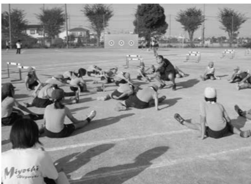
▶中学校の先生や陸上部生徒による指導

専門的な技術を学ぶ 10月12日水曜日、晴天に恵まれ、三芳町小学校連合運動会が総合運動公園で開催されました。連合運動会とは、三芳町内の5つの小学校の5、6年生の全員が参加して「走る」「跳ぶ」「投げる」を中心とした陸上競技大会です。ここ数年