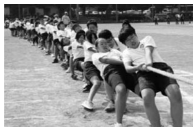
オーエス！オーエス！力を合わせた「綱引き」

全員参加種目は100メートル走です。高学年になると体力もつき、100メートルを全力で走る力が備わってきます。 選択種目は、ドッジボール投げ、80メートルハード