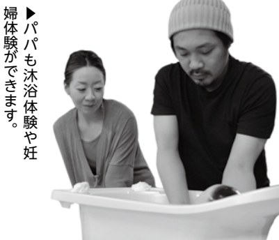
▶パパも沐浴体験や妊婦体験ができます。