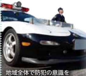
地域全体で防犯の意識を