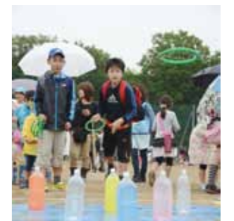
↑あいにくの雨の中、多くの来場者が雨傘、輪投げなどの遊びを楽しみました。

5月11日(土)、役場前の総合運動公園で子どもフェスティバルが行われ、雨の降るなか約7,000人が来場しました。小さな動物と触れ合うこともできるこの催しに、親子連れで訪れる姿が多くみられ、各地区ごとに出店された輪投げコーナーや、的にボールを投げるコーナーなどで楽しみました。