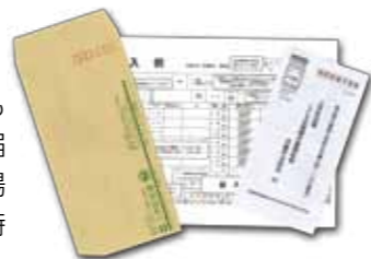
担当窓口へ提出していただく書類は、必要事項を記入し、封筒に入れて送付してください。

※受給者の所得が右記の額以上の場合、特例給付として児童1人あたり月額一律5,000円を支給。