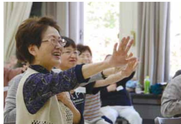
↑いもっこ体操は、簡単に動けるようにゆっくりと体を動かします。

4月16日(火)、23日(火)、5月7日(火)の3日に分けて、肩こりや腰痛についての原因と解消法を運動をしながら学ぶ「にっこり運動教室」が行われました。3日目には「いもっこ体操、をこの日集まった約50人の皆さんが体験し、年を重ねると悩まされる「体のコリ」体操を通じてゆっくりとほぐしていきました。皆さん笑顔で、心まで「ニッコリ」になりました。