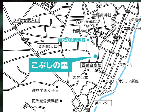
【こぶしの里】三芳町竹間沢 1081-1 車でお越しの際には案内看板に従ってください。

こぶしの里。わき水が小川となって流れる、自然の散策道。春にはこぶしの花をはじめ、たくさんの花が咲き誇ります。そのこぶしの里でホタルが舞うこの写真は、昨年(2023)の6月3日に撮影したものです。ホタルはメスをオスが追いかける習性があり、この写真から、上昇して逃げるメスと追いかけるオスの様子が分かります。今年もホタルの幻想的な光をお楽しみください。