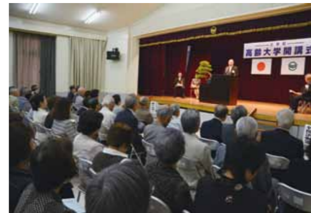
↑開講式の様子。和やかな雰囲気、時には笑いが起こりました。

快晴に恵まれた5月9日(木)、藤久保公民館で「高齢大学開講式」が行われました。藤久保教室第31期、中央教室第29期、竹間沢教室第22期と歴史あるこの高齢大学に、皆さんは新しく始まる楽しいキャンパスライフに胸躍らせていました。今年度は町内在住の60歳以上の214人が参加し、自らの知識や交流を深めています。