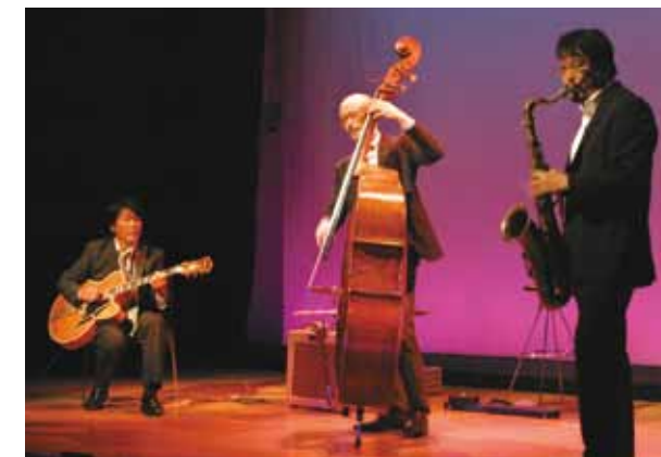
↓東京銘曲堂の皆さん。間近で見る生演奏は心に響きます。