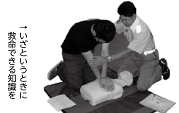
救命講習の知識を

自治安心課地区消防組合消防本部救急課 ☎ 261-6673 (平日のみ 8:30～17:00)