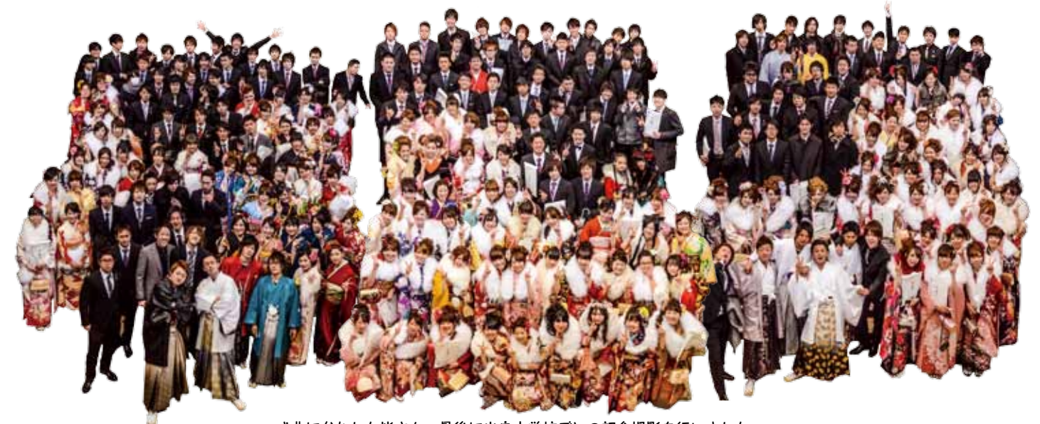
式典に参加した皆さん。最後に出身中学校ごとの記念撮影を行いました。(左から三芳東中、藤久保中、三芳中)

※掲載された人で希望者には写真データをメールで差し上げます(当日参加した新成人に限ります)。住所・氏名・出身中学校・希望する写真・広報の感想を記入のうえメールでご連絡ください。メールアドレス: hisyo@town.saitama-miyoshi.lg.jp 問い合わせは秘書広報係 ☎ 258-0019 内線 314 まで。