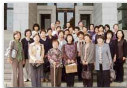
↑ 現在約 60 人がボランティア活動中