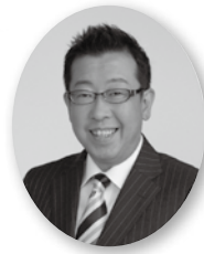
管理者 (ふじみ野市長) 高畑 博