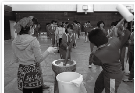
2人一組で餅つきを全校生徒が体験

年の瀬をむかえた12月20日、本校恒例の餅つき大会が盛大に行われました。この催しは、かつては正月を前にしたこの時期、多くの家庭や地域で行われていた餅つきを生徒たちに体験してもらおうと学校と保護者たちが企画しました。今年で10年目をむかえ本校の伝統行事となり、2学期の期末テストが終わると生徒の多くが餅つき大会を楽しみにしています。 本校の体育館には前日から木や石の臼が8つ並べられ、3年生とけやき学級から順に学年ごとに餅つきをしました。体育館の外に用意された釜で115キロの餅米が蒸され、生徒たちが蒸しあがった餅米を「よいしょ」などと声を掛け合いながら元氣よくついたあと、保護者たちが一口大の団子にして、きな粉やあんこ、大根おろしなどをつけました。また、学校ファームでけやき学級の生徒が育てた大根や里芋、白菜のほか、地域の人たちから提供されたにんじんやごぼうなどを使った豚汁も作られ、生徒たちは、餅と一緒においしそうに味わいました。前日に給食が終了しているのに、昼食代わりにお腹がいっぱいになるまで、何度もおかわりをして