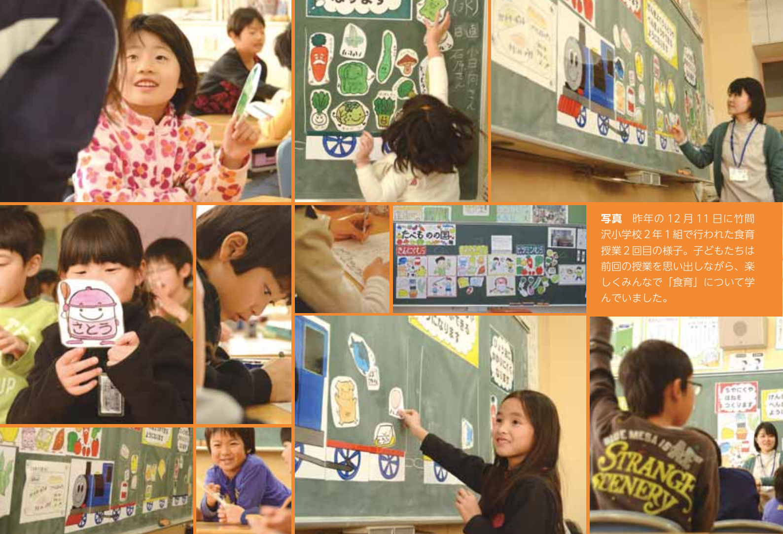
写真 昨年の12月11日に竹間沢小学校2年1組で行われた食育授業2回目の様子。子どもたちは前回の授業を思い出しながら、楽しくみんなで「食育」について学んでいました。

町では今年度から栄養教諭を配置し、各学校で食育指導の授業を行いました。食育について理解を深め、家庭でも意識してみませんか？