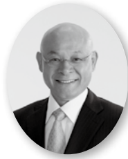
副管理者 (三芳町長) 林 伊佐雄