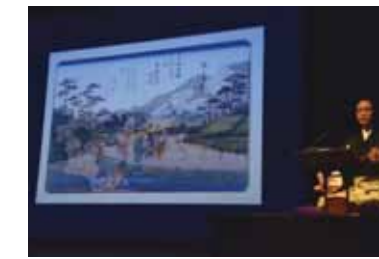
↑映像と説教節の演奏が融合。演出に工夫がみられる。

12月16日(日)、コピスみよしで竹間沢車人形公演が行われ、約300人が来場しました。人形の息吹、鼓動を生で体験し、「実際に観ると迫力が違う。これからもずっと続けていってほしい。」という声が聞こえました。