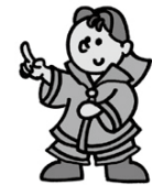
もう設置しましたか 住宅用火災警報器