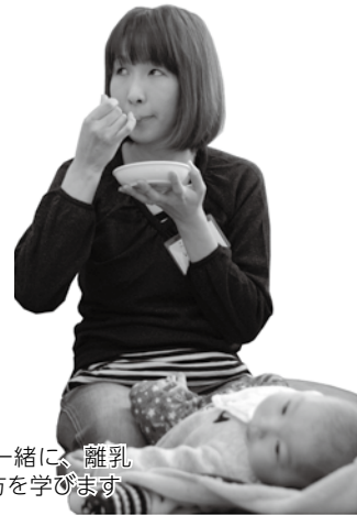
赤ちゃんと一緒に、離乳食の作り方を学びます