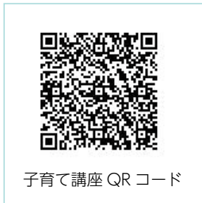
子育て講座 QR コード