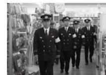
戸口消防長による巡視の様子

12月20日、歳末特別警戒を行い、災害時における利用者の安全確保がされている事を確認し、継続して防火安全対策の指導を行いました。