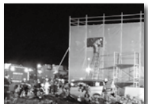
夜間に行われた救出訓練

11月29日~30日、自衛隊朝霞訓練場で1都9県の消防隊・救急救助隊など280部隊が参加し、大規模災害発生時対応のために合同訓練を行いました。