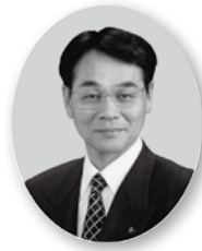
副管理者 (富士見市長) 星野 信吾