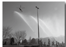
出初式での一斉放水の様子

1月13日に三芳町役場で恒例行事の消防出初式が行われました。年頭にあたり防火・防災への決意が込められています。