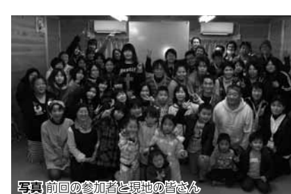
写真前回の参加者と現地の皆さん

東日本大震災により被災された地域や住民を応援するため、復興支援バスパックを実施します。現地でふれあいサロンのボランティアとして、お話し相手や子ども遊び相手などをします。