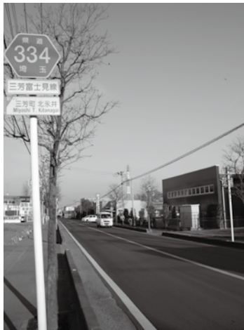
写真 県道三芳富士見線と重なる河岸道

県道三芳富士見線も河岸道と呼ばれますが、三芳中交差点から上富下組までの間は、三芳村に四校あった小学校が三芳尋常高等小学校（現三芳小）に統合された大正四年、上富地区から本校に通う児童の利便性を図るために開通し、大正六年に公道として認可された新道部分は除かれます。三芳中前から始まる河岸道は、東上線の踏切を越えた鶴瀬交差点までは県道三芳富士見線と重なります。河岸道は鶴瀬交差点を直進し、富士見台中前で北永井からの河岸道と合流し、本河岸へと続きます。 県道三芳富士見線の南側、町道幹線二〇号線も河岸道と呼ばれます。江戸時代より町を東西に貫く主要道となっていたように、この道と上富けやき並木通りとの交差点と川越街道との交差点にある旧家では、かつて運送業を営んでいたと伝えられます。この道は所沢市中富境から東に向かい関越を越え、北永井中央通りを横切り浄水場前に至ります。藤久保境で鍵の手となり林と工場間の道を抜け、川越街道を越え藤久保