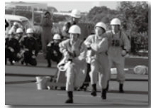
速さと正確さを競います

10月11日に、当消防組合消防訓練場で、管内の事業所など29チームの出場により、自衛消防隊消防操法競技大会を実施しました。