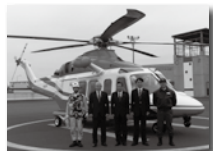
管内上空偵察飛行訓練

11月26日に、消防訓練場で埼玉県防災航空隊新型ヘリコプター導入に伴う大規模災害発生時対応を目的とした合同訓練を実施しました。