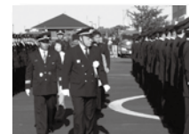
郷土愛護の精神で地域防災

11月18日に、消防訓練場で消防団員の人員、服装、規律、車両点検が行われました。災害が発生した時、消防隊員と共に活動を行います。