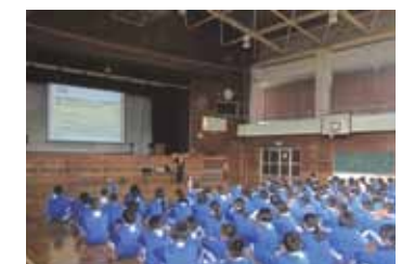
▲町内の中学1年生を対象に行われた「スポーツと栄養について」の授業の様子。学年集会という形で実施。