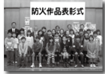
火災予防キャンペーン