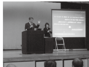
自治基本条例の学習会の様子