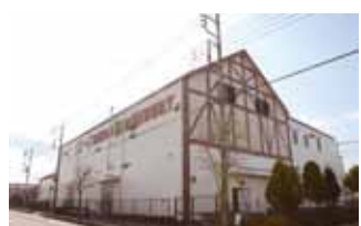
コエドブルワリー三芳工場 住所: 上富385-10 ☎ 259-7735 お酒は20歳を過ぎてから。

今回のプレゼント協力は2012年ヨーロッパビアスターで最高位の金賞を受賞したCOEDOビールさん。世界に愛されるビールがこの三芳町で製造されています。