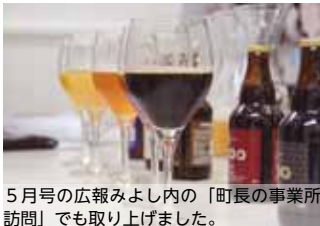
5月号の広報みよし内の「町長の事業所訪問」でも取り上げました。

【お店から】富の川越いもを原料の一部に使用した紅赤-Beniaka-を始め、コエドビール全種類を詰め合わせたセット(6本)を2名様にプレゼントします。世界に認められた味わいをお楽しみください。