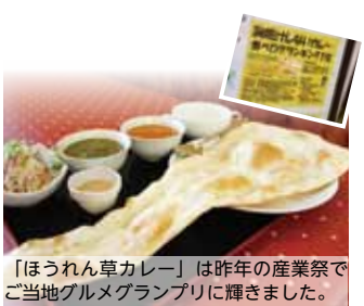
「ほうれん草カレー」は昨年の産業祭でご当地グルメグランプリに輝きました。

今回のプレゼント協力は「ぐるかり」さん。お店のカレーは動物油脂を使用せず、新鮮な素材のみでコクを出しているため、胸焼けしません。埼玉B級グルメ王決定戦に出品する「ほうれん草カレー」は辛すぎず、ほうれん草の甘みとマッチし、大人も子どもも美味しく食べられます。