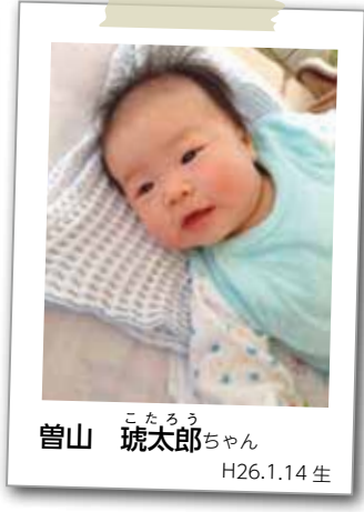
曾山 こたろう 琥太郎ちゃん H26.1.14 生