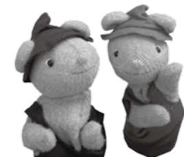
絵本「ぐりとぐら」主人公の人形