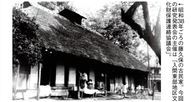
「昭和38年ごろの藤久保の古民家。今回文化財保護連絡協議会主催の「入間東部地区文化財研究発表会」の主催は「入間東部地区文化財保護連絡協議会」。

一 芳町・富士見市・ふじみ野市の歴史について、 二 各市町の学芸員・研究者が最新の研究成果をわかりやすく解説します。