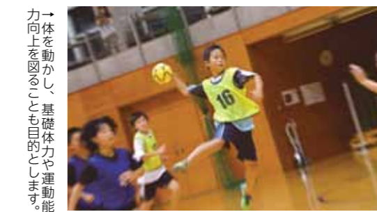
→体を動かし、基礎体力や運動能力向上を図ることも目的とします。

ハ ンドボールの基本、パス・キャッチ・シュートを通じてコミュニケーションの向上、ハンドボールの楽しさをゲームをしながら体感します。また、未経験者でも安全で安心して練習できます。