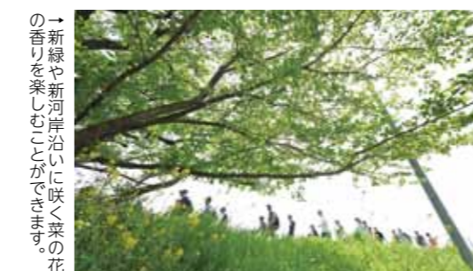
→新緑や新河岸沿いに咲く菜の花の香りを楽しむことが出来ます。