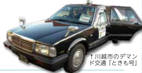
↑川越市のデマンド交通「ときも号」

新 なた 公共交通として「デマンド交通」の試行運転を秋に実施します。デマンド交通とはバスでもタクシーでもない新しい移動手段です。町内各所に停留所(共通乗降場)を設け、タクシー車両を使いバスのように乗合をして運行を行います。運行に先立ち、このデマンド交通の愛称を募集します。(運行の詳細は後日広報などでお知らせします。)