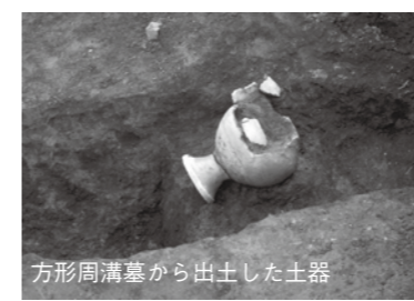
方形周溝墓から出土した土器

た。現在までに11地点の調査が行われ、弥生時代後期の竪穴住居跡、1.5メートル以上の深さがあるV字状の大溝、方形周溝墓と呼ばれる溝で囲まれた弥生時代の墓などが確認されています。 方形周溝墓は、弥生時代中期から古墳時代前期にかけて出現する墓の形態ですが、当時の人々が誰もが方形周溝墓に葬られたわけではありません。おそらく、コメ作りなどでつながらる集団を統率する有力者の墓であったと考えられます。本村南遺跡のこれまでの発掘調査では被葬者や埋葬された痕跡は発見されていませんが、溝からは底部や胴部に意図的に穴をあけた壺形土器などが出土しました。これらの土器は方形周溝墓に供えられたもので、わざと穴をあけることで、日常の世界(生)とは違う場所(死)であることを示すためのものだと考えられています。