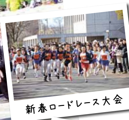
新春ロードレース大会