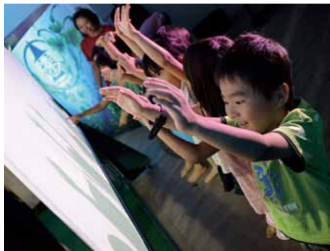
会場は超満員。まるで映画のようなストーリー、影絵とは思えないダイナミックな動きは圧巻でした。