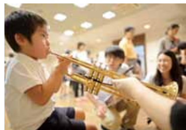
↑初めて吹いたトランペット。子どものセンスの良さにパパもびっくり!

8月24日、コピスみよしで行われたサマーフェスティバル。スギテツ・シンフォニエッタみよし・町内中学校吹奏楽部(有志)が出演。オーケストラや吹奏楽の楽しさを来場者に届けました。公演前後には楽器体験が行われ、音が鳴ると自然と笑顔がこぼれ、子どもから大人まで、幅広く楽しむことができました。