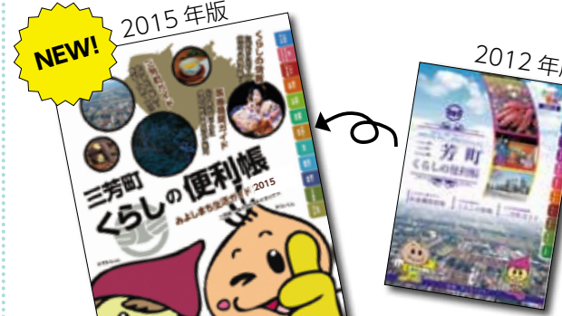
※写真は制作中のものです。