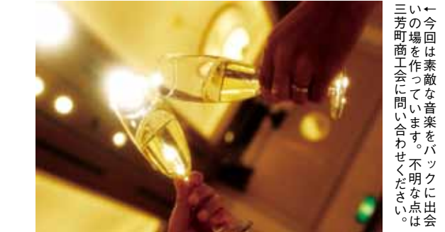
←今回は素敵な音楽をバックに出会える場を作っています。不明な点は三芳町商工会にお問い合わせください。