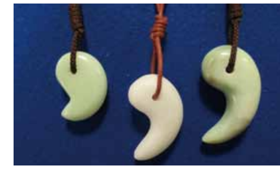
←どのような、まが玉ができるのか。自分だけの作品を作ってみませんか。

縄文時代から作られていたまが玉。先史・古代の日本における装身具の一つで、祭祀にも使用されていたといわれています。石を削って、そのまが玉を作ってみよう!