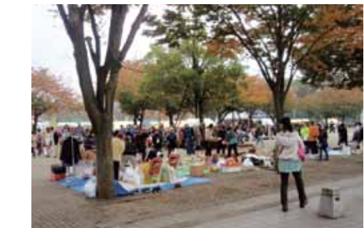
←昨年の様子。協働のまちづくりネットワーク「みどり環境グループ」エコ推進実行委員会が主催で行われます。

コピス前広場でフリーマーケット開催！掘り出し物が手に入るかもしれません。出店希望の人は環境課まで申し込みください。