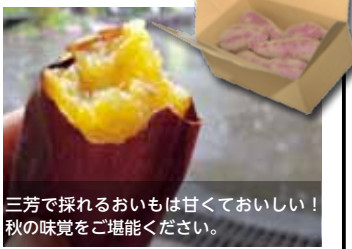
三芳で採れるおいもは甘くておいしい！秋の味覚をご堪能ください。

【お店から】三富新田の特産品をそろえた農家ショップです。秋からは富の川越いもを販売しています。今月のプレゼント協力は江戸屋弘東園さん。いものようかん「富のうまかろう」などオリジナル商品が人気です。