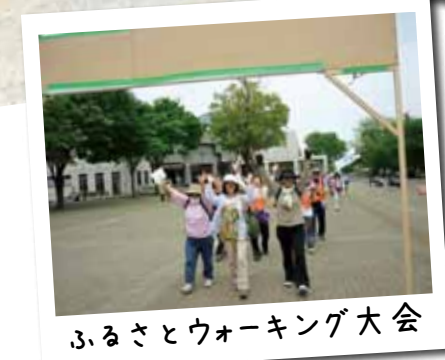
ふるさとウォーキング大会

テニスの全米オープン男子シングルスで錦織圭選手が準優勝、あと6年に迫った東京オリンピック、そして近年の健康志向の高まりを受け、今、スポーツに注目が集まっています。今月号の特集はスポーツ。そのチカラの魅力に迫ります。