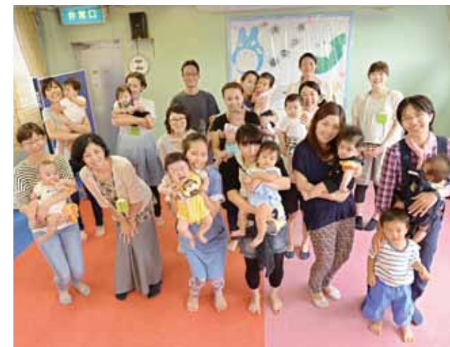
出産前の不安な気持ちを共有したり、先輩ママの実体験を聞いたりします。未来のパパも参加してくれました。

8月25日に藤久保児童館2階で行われた保健センターの両親学級と子育て支援センターのねんね広場。出産を控えた家族と0歳の子どもを持つママとの交流会が行われ、地域に密着した情報交換が行われました。ママ友を作ることもつながり、好評を得ているイベントです。