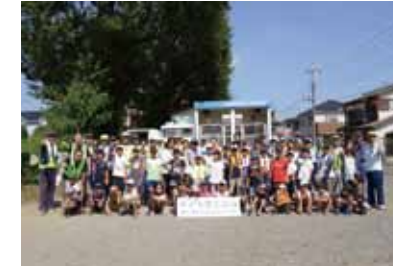
↑当日の様子はFacebookにも公開しています。いいね三芳町で検索!

8月20日、藤久保3区集会所と北松原公園で夏休みこども防災訓練が行われました。「東日本大震災の時、防災訓練が活かされました。自分の命、財産を守るためにもこうした体験が大切です」と役員から話があり、子どもたちも楽しみながらも、真剣に訓練を行い、最後は町長が一人ひとりに修了証を手渡しました。