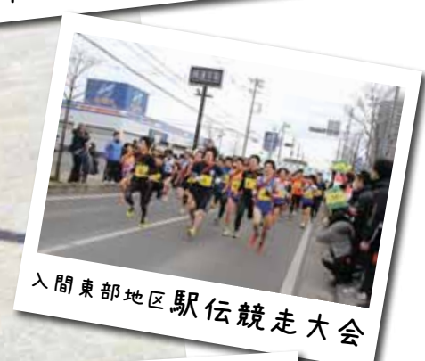
入間東部地区駅伝競走大会