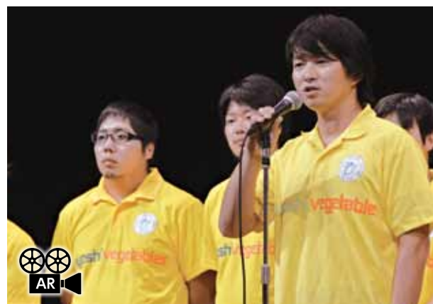
↓ARとYoutubeでオープニングムービーをご覧ください。

毎年8月23・24日に行われる木ノ宮地蔵堂、夏の縁日。祭礼時には地蔵堂内の天井画が公開され、江戸時代中期に描かれた絵を見ることができます。さらに上富囃子保存会による山車と上富囃子の囃子奉納が行われ、縁日に音色を添えてくれました。春の地蔵堂の様子や昭和40年代の縁日の様子などもFacebookでお伝えしていますのでご覧ください。