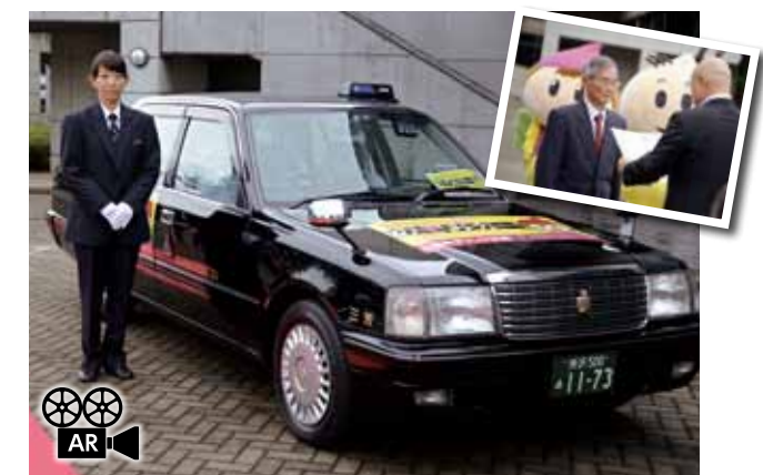
↓愛称募集に257点の応募がありました。ご応募ありがとうございました。