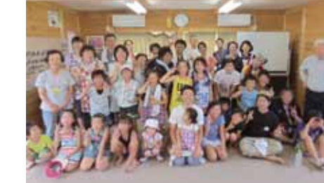
←今回で9回目となり、現地の子どもたちとの距離が縮まってきました。

子どもが好き・料理が好き・食べることが好き・楽器演奏が得意・歌うことが好きな人。福島第一原発事故で避難している人が住む『がんご屋仮設住宅』で行う“うたごえ喫茶”と“ミニスポーツ大会”の運営ボランティアとして参加しませんか？