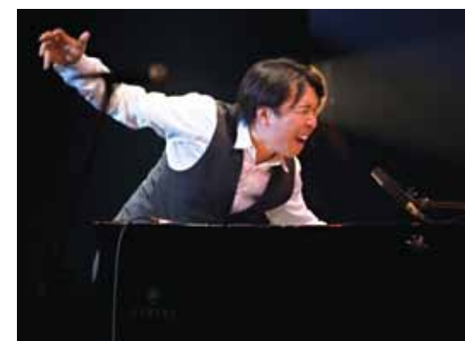
←FM番組のパーソナリティーを務めるほか、テレビ番組のサウンドトラックや映画舞台音楽を手掛けるなど幅広く活躍しています。

世界の小曾根がコピスに初登場！休日の午後、世界最高峰のエンターテイナーが魅せる至福のひととき…その名も「Afternoon JAZZ (午後のジャズ)」。