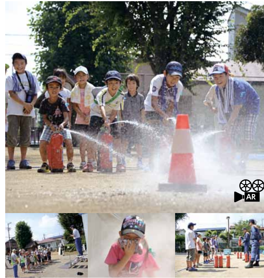
↓約240人がこのイベントに参加しました。ゆるきゃらも応援に。

フォトニュースに掲載しきれないイベントや写真は町のFacebook「いいね!三芳町。」で配信中。ロゴがあるイベントは関連した情報などをFacebookで公開しています。