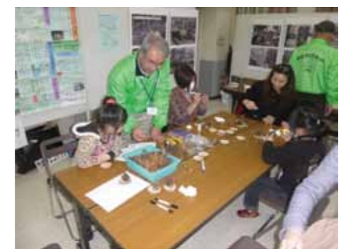
←前回の協働のまちづくりフェアの様子。子どもからお年寄りまで幅広い世代がまちづくりの魅力体験できる、三芳町の魅力がギュッと詰まった楽しいイベントです。

ま ちづくりの魅力を、楽しみながら身近に感じることができるイベント「協働のまちづくりフェア」。町内で活躍している様々なまちづくり団体が参加。特にボランティアに興味のある人、地域デビューしたい人は、ぜひ会場へお越しください。子どもも楽しめるイベントも企画しています。