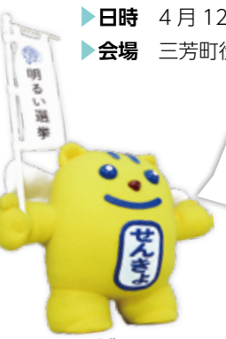
(明るい選挙のイメージキャラクター選挙のめいすいくん)