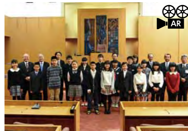
↓終了後、この日参加した子どもたちと集合写真を撮影しました。