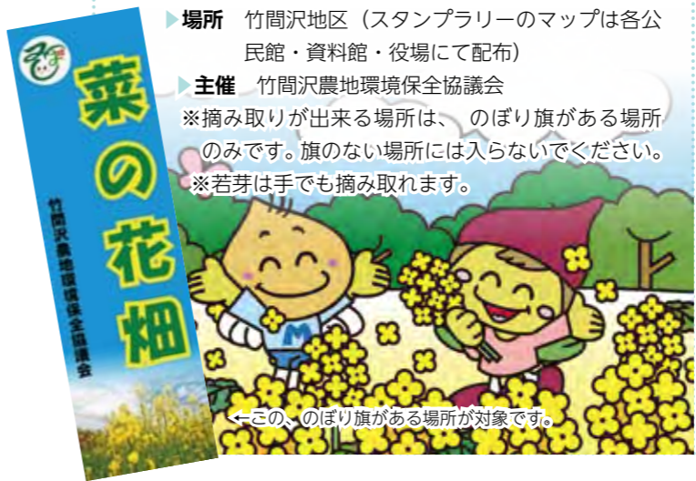
←この、のぼり旗がある場所が対象です。