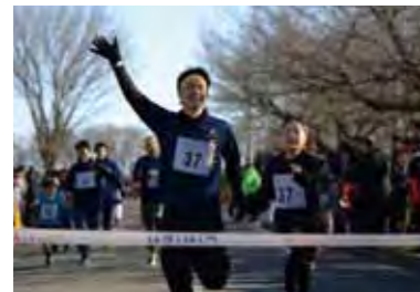
↑最初の競技は親子でペアを組み競走。ゴールテープを切ったのはこの親子。

今年で35回を迎える新春ロードレースが1月18日(日)に行われました。毎年恒例となったこのイベントに多くの選手や応援する家族の姿が見られました。ゴール前ではデッドヒートが繰り広げられるなど、白熱した争いも随所に見られ、応援する皆さんも力強い声援を選手に送っていました。