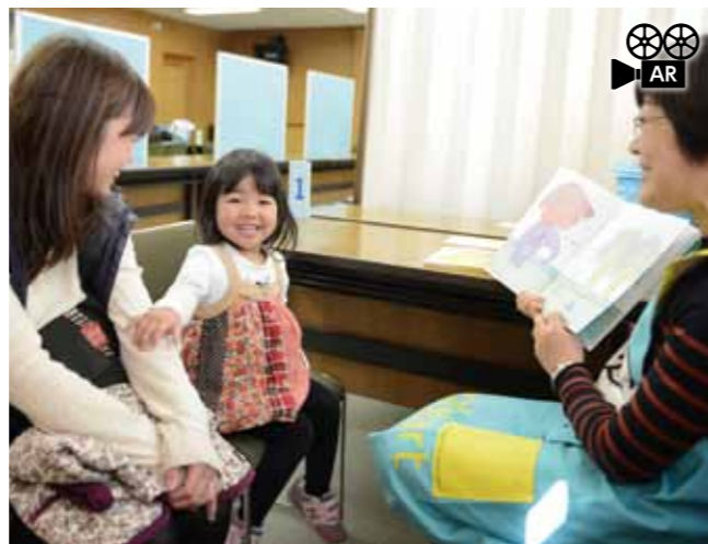
読み聞かせをするのはボランティアスタッフの皆さん。工夫をしながら質の高い読み聞かせを行っています。