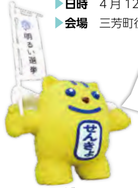
(明るい選挙のイメージキャラクター選挙のめいすいくん)