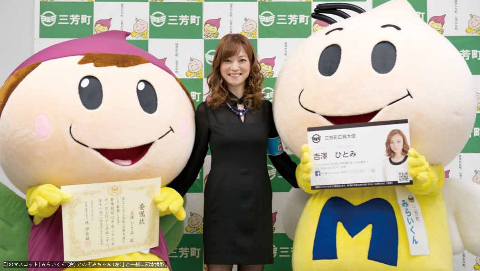
町のマスコット「みらいくん(右)とのぞみちゃん(左)」と一緒に記念撮影。