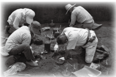
中東遺跡第6地点(4次)の調査の様子

う発掘調査の結果、弥生時代の住居跡1軒・近世~近代の溝跡1条などが発見されました。また、溝跡の下層約2万8千年前の旧石器時代の層から15cm大のチャートの塊が発見されました。表面には石器を作るために叩いた跡が残っていますが、周囲には飛び散った破片はなく、その場で石器を作った訳ではなさそうです。持ち歩いてきた原石を落としてしまったか、重たいために置いていったのではないかと想像されます。 【本村南遺跡第12地点】(竹間沢836-1ほか) 個人住宅建築に伴う発掘調査の結果、約2千年前の弥生時代の住居跡1軒が発見されました。土間のように固く踏みしめられた床面には、屋内で火を焚いた炉の跡や柱を立てた穴も残っていました。今回の発見により、これまで周辺で確認されていた弥生時代の集落が、広範囲に広がっていることが明らかになりました。