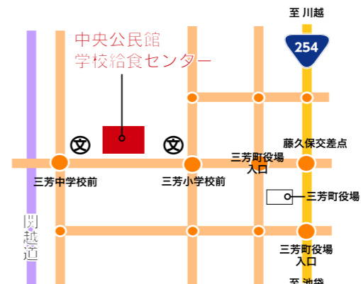
中央公民館・学校給食センター 場所 / 三芳町北永井348番地2 (三芳中学校と三芳小学校の間です)

利用期間を設け、試験的に利用していただく予定です。 内覧会、お試し利用についての詳細は今後、公共施設予約システム、ホームページ、パンフレット等でお知らせしていきます。 学校給食センター 学校給食センターは、4月1日(水)から正式稼働し、4月10日(金)から給食調理を開始します。常に床を乾いた状態で調理ができる「ドライシステム方式」を採用するなど、衛生管理も徹底しています。安全で安心して食べられる、おいしい給食を提供していきます。