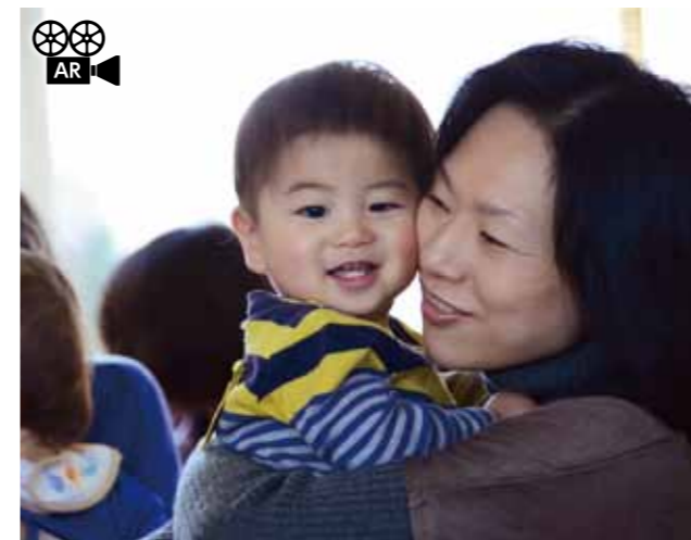
手作りのマラカスが特にみんなお気に入り。歌に合わせて音を出しました。歌が終わっても手放さない子の姿も。

2月4日(火)、藤久保児童館2階で、あそびのへや(ひよこクラス)が開催されました。多くの親子が参加し、絵本や手遊び、歌や踊りを楽しみました。たくさんのおともだちと楽しんだ「あそびのへや」も2月いっぱい終了です。来年度の案内は次号の広報でお知らせします。