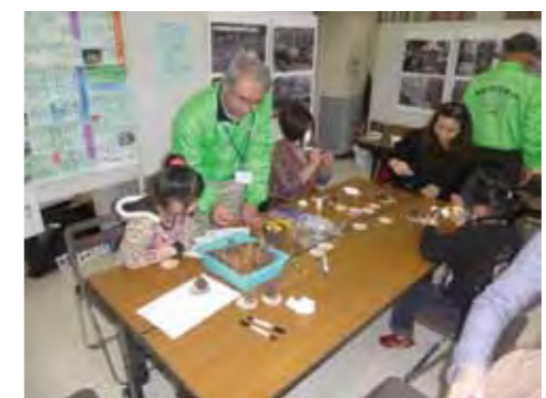
←前回の協働のまちづくりフェアの様子。子どもからお年寄りまで幅広い世代がまちづくりの魅力を感じ、三芳町の魅力がギュッと詰まった楽しいイベントです。

ま ちづくりの魅力を、楽しみながら身近に感じることができるイベント「協働のまちづくりフェア」。町内で活躍している様々なまちづくり団体が参加。特にボランティアに興味のある人、地域デビューしたい人は、ぜひ会場へお越しください。子どもも楽しめるイベントも企画しています。