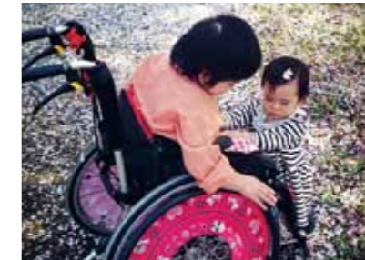
前回の写真コンテスト最優秀作品「ハナ*シマイ」。町内自宅周辺で撮影した写真。

フィルム時代は現像するまでどんな写真が撮影できたのか分かりませんでした。今はスマホで簡単に撮影でき、その場で確認できるのでたくさん撮るようになりました。動画だと見逃してしまう子どもの表情も、写真だとその一瞬をとらえることができることが魅力の一つですね。町内のおすすめは北永井の畑や小道です。子どもの成長と一緒に町の成長も写真に残していきたいです。