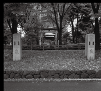
↑木宮稲荷の幟立て(下り車線を挟んだ奥には、木宮稲荷の鳥居が見える)

のには「昭和十一年十月」の紀年銘が、向かって右側のものには「氏子三芳村養蚕実行会」(以下は地中に埋まっているため判別できない。見つかっている文書から「養蚕実行組合」であると思われる)の奉納した団体名が刻まれている。幟立てに刻まれているこれらの内容からは、木宮稲荷神社の境内から幟立てが切り離されたのが造立から間もない時期だったことや、木宮稲荷神社の祭礼には養蚕実行組合が深く関わっていたことが伺える。現在の幟立ては、下方が中央分離帯に埋まり、幟立て本来の役目を終えてはいるが、昔の木宮稲荷神社の名残と川越街道の歴史を現在に伝えてくれている。