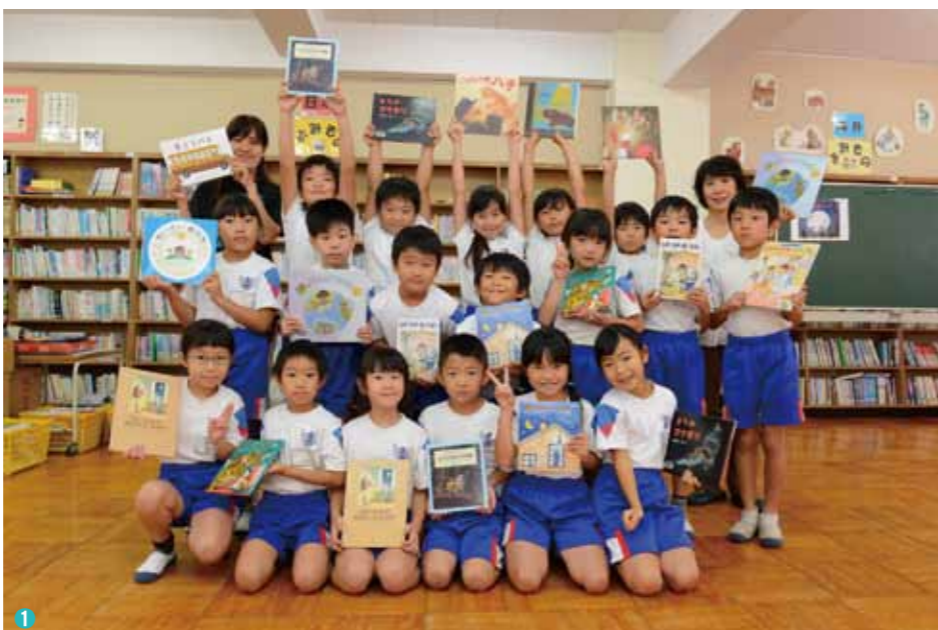
① 9月28日に上富小学校で行われたブックトーク授業訪問。図書館と学校が連携し、まちぐるみで子どもを本好きにする取り組みを行っています。② 終了後にさっそく本を借りる児童たち。早く手にしたくてウズウズしています。