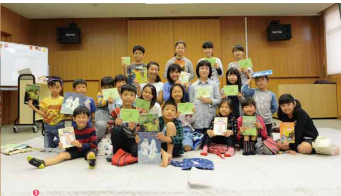
① 10月22日に開催した「としよかんくらぶ」3～6年生の部に集まった子どもたち。この日の紹介本と会員証を手にして、とっても嬉しそうな表情を見せてくれました。② 貸出する本を今か今かと見つめる。③ 休憩時間もみんな本を読んでいます。小さなころから本に触れ合うことができる三芳町の取り組みが成果として出てきていることを実感できます。